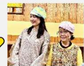
それぞれに似合う被り方で記念撮影。素敵なお二人

「帽子deちょっと良い話」や、みなさまの帽子の活動情報(イベント出展・イベント掲載など)の情報を募集中をしています。ぜひ、お知らせください。※紹介イベントは、事情により、急遽変更・中止される可能性もありますので必ず「当日に開催をご確認の上」ご来場ください。